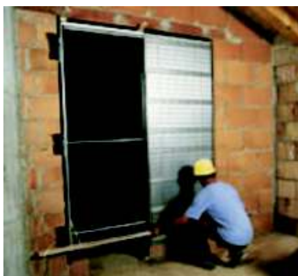
Faza 14 sprawdzamy czy krawędzie kasety nie wychodzą poza ścianę