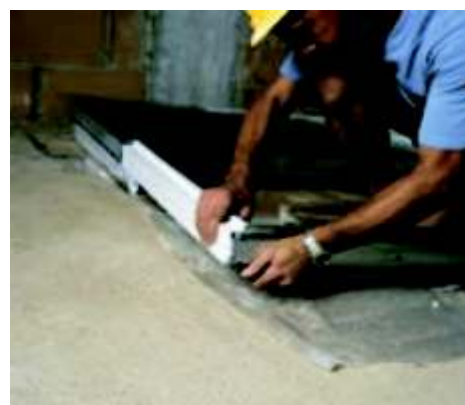
Faza 6 dostawiamy nogę dobojową (tylko w kasecie pojedynczej)