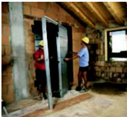
Faza 11 kasetę wstawiamy do wcześniej przygotowanego otworu