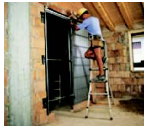
Faza 12 następnie całość klinujemy ustawiając pion i poziom.