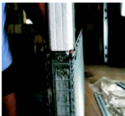
Faza 5 następnie całość skręcamy z góry wkrętami