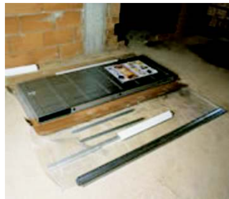
Faza 3 przygotowanie elementów do montażu