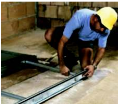
Faza 10 całość konstrukcji jest gotowa do montażu