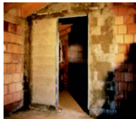
Faza 18 kasetą gotową do tynkowania.