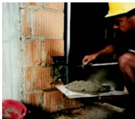
Faza 16 najpierw tynkujemy zaprawą nogę dobojową kasety.