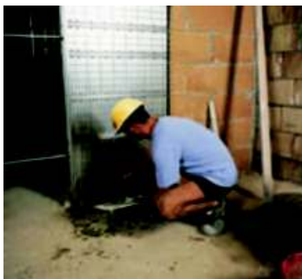
Faza 17 obmurowujemy całą kasetę dookoła.