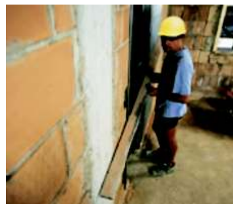
Faza 15 jeszcze raz sprawdzamy dokładność ustawienia kasety.