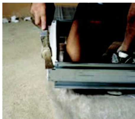
Faza 7 zaginamy blaszki na belce górnej