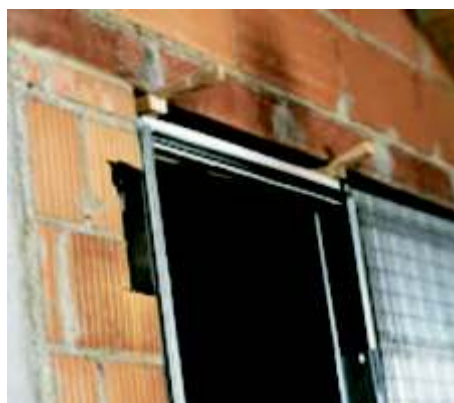
Faza 13 nogę dobojową mocujemy do ściany..