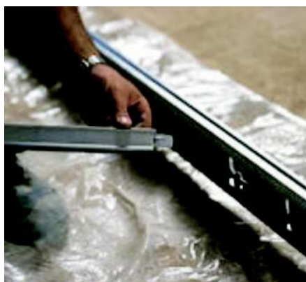
Faza 8 mocujemy poprzeczkę dystansową