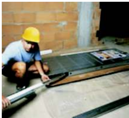
Faza 2 wyjęcie poszczególnych elementów