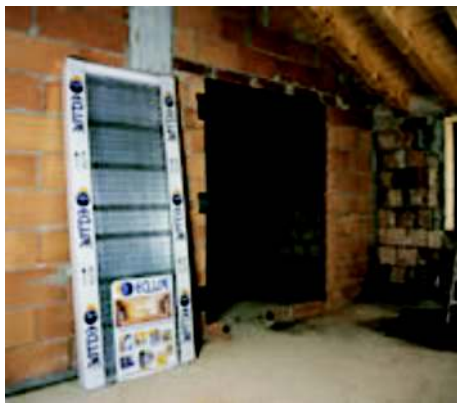
Faza 1 rozpakowanie kasety