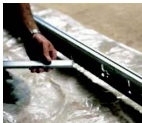
Faza 9 mocujemy drugą poprzeczkę dystansową.